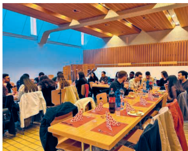
Una cena di condivisione e gioia