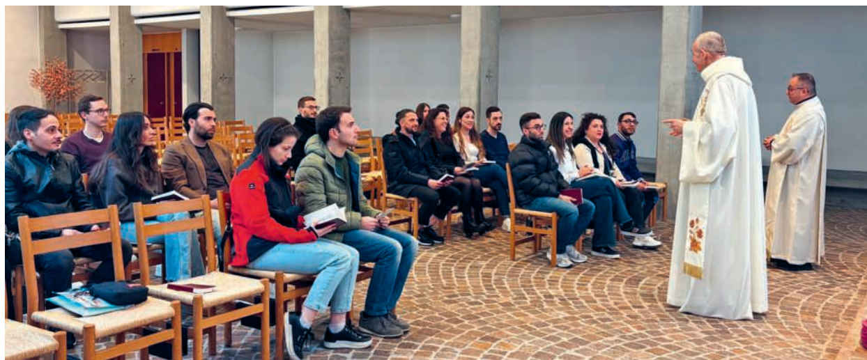
Le giovani coppie immortalate con i sacerdoti, prima della Santa Messa