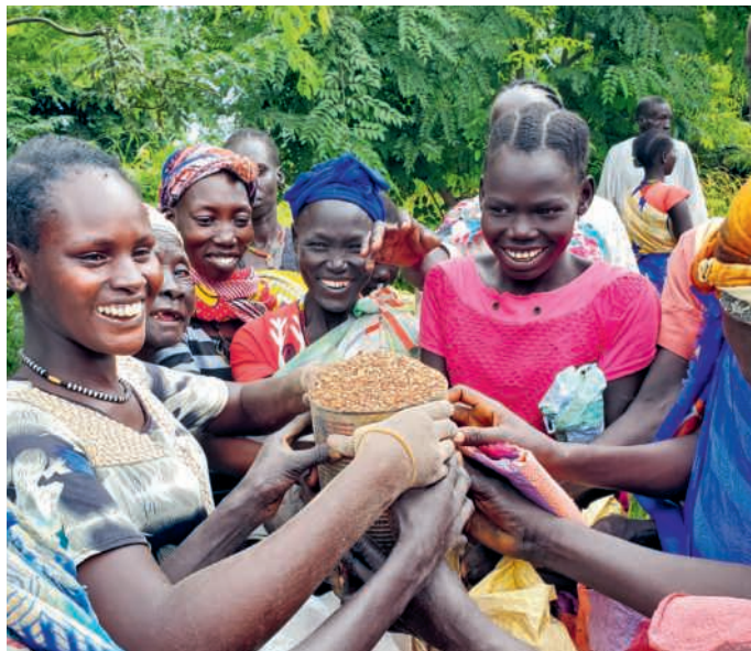
Mani unite e sorrisi liberi: la speranza che resiste