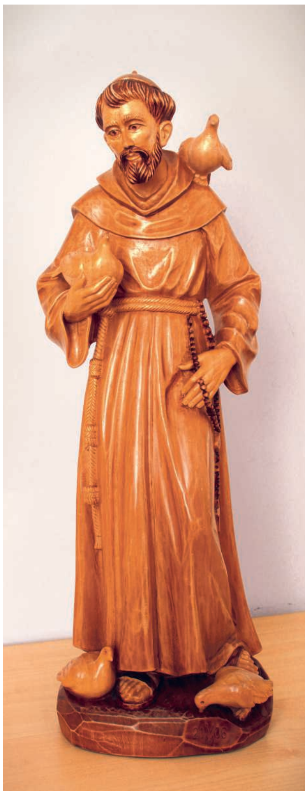
Statua di San Francesco d'Assisi oggetto di venerazione per i fedeli italiani, conservata nella sede della Missione cattolica italiana di Winterthur.