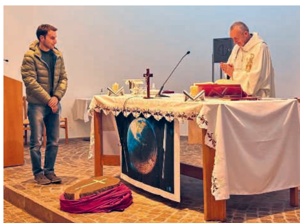
Invocare la propria supplica a Dio, mediante la preghiera