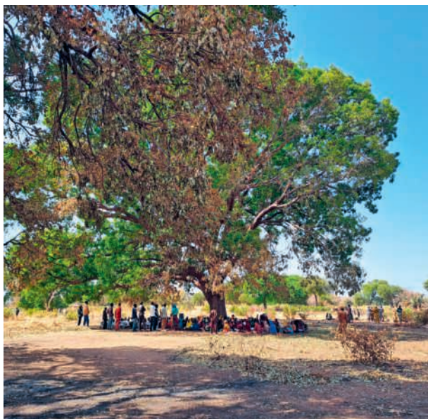
Un popolo ritrovato all'ombra della speranza