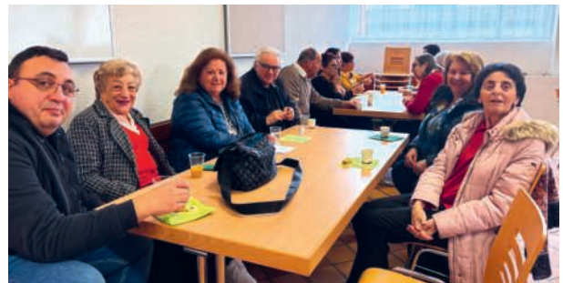
Lieto ritrovo durante la pausa