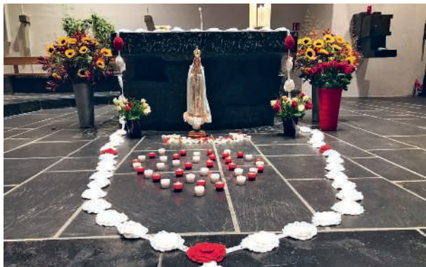
Decorazione per S. Messa «Mariana» a Hombrechtikon