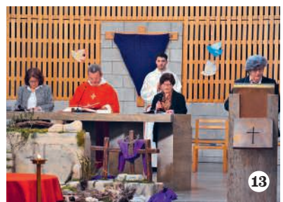
1 Passione vivente, Schlieren 2 Via Crucis, Schlieren 3 Taglio ulivi, Dietikon 4 Colorazione uova, Schlieren 5 Giovedì santo, Dietikon 6 Alpha Live, Dietikon 7 Coro Italiano, Dietikon 8 Coro Voci Bianche, Pasqua, Dietikon 9 Carnevale bambini, Obfelden 10 Festa papà, Affoltern a. A. 12 Taglio ulivi, Affoltern a. A. 12 Domenica delle Palme, Affolter a. A. 13 Venerdì santo, Affoltern a. A.