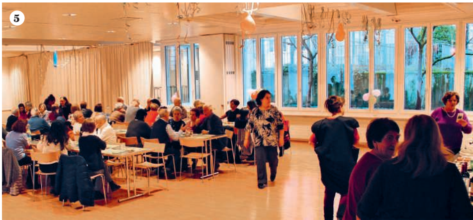
1 Pomeriggio informativo, «Dipendenza da antidolorifici» 2 Cresime Adulti, gennaio 2026 3 Cresime Adulti, gruppo Ministranti 4 Cresime Adulti, Corale Parrocchiale 5 Castagnata Adultissimi 6 Carnevale Comunitario, bimbi in maschera 7 Carnevale Comunitario, gruppo Over 40