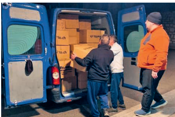
Furgone carico - partenza per il deposito e per l'Ucraina

D alle notizie del telegiornale che ci facevano vedere l'orrore della guerra in Ucraina, è venuta l'idea di lanciare un'azione di raccolta di solidarietà per loro. Vedere come tanta gente soffriva di freddo e di fame, ci ha commossi, e siccome noi come Missione Italiana avevamo già fatto in autunno scorso una raccolta del genere, con un ottimo risultato, si è pensato, perché non riprovarci.