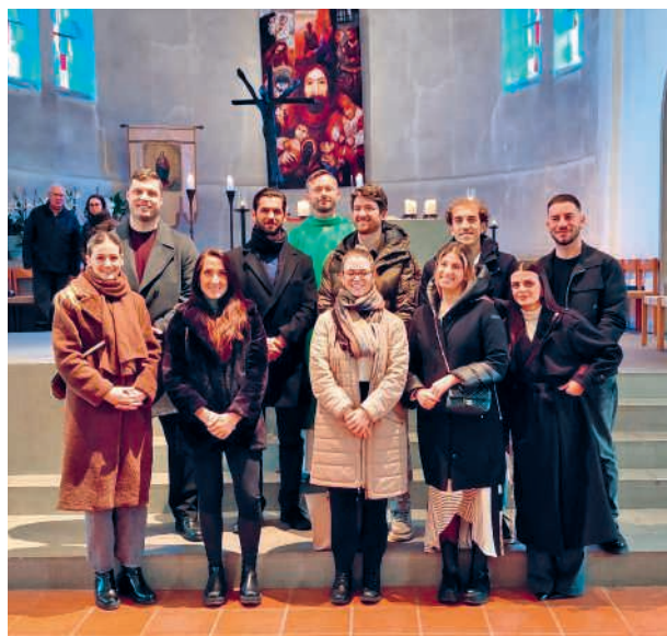
Sposi Corso Prematrimoniale