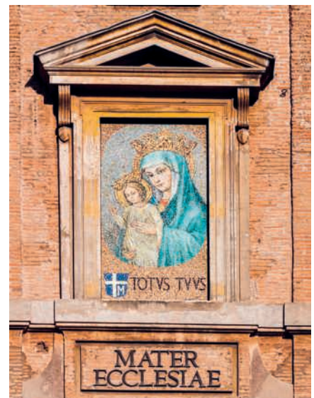
Mosaico Mater Ecclesiae

«Noi non siamo mai soli» ricorda Francesco. Siamo accompagnati dagli angeli, e non solo dagli angeli, ma dai