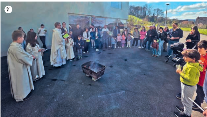
1-2 Festa di Carnevale 3-4 Ginnastica e Balli Pensionati Horgen e Wädenswil 5 Preparazione Palme 6-7 Celebrazione di Pasqua Bambini