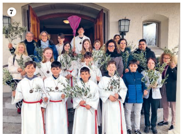
1 Carnevale dei pensionati a Stäfa 2 Un pomeriggio con la poesia 3 + 4 Via Crucis a Hombrechtikon 5 Carnevale della terza età a Rüti-Tann 6 Gita dei chierichetti 7 Domenica delle Palme a Stäfa 8 Preparazione dei regali di Pasqua