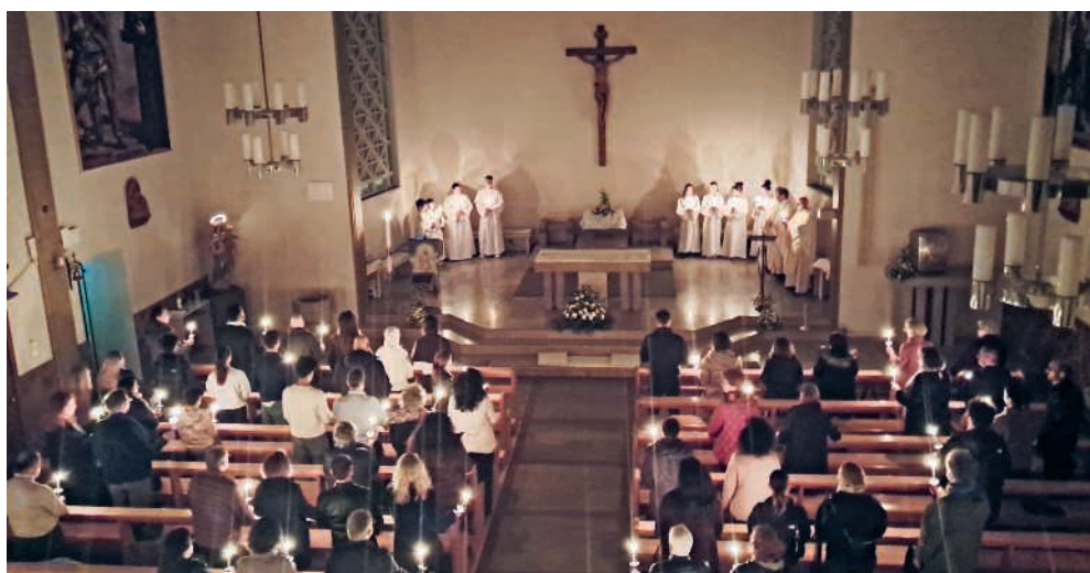
La luce della fede illumina la notte della comunità.