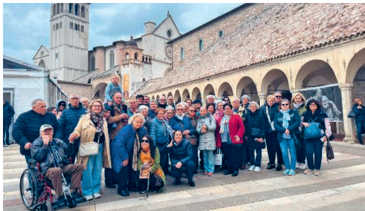
Partecipanti al pellegrinaggio

Orari di apertura tutte le mattine ore 8.30-12.00, pomeriggio (tranne mercoledì e venerdì) ore 14.30-18.00