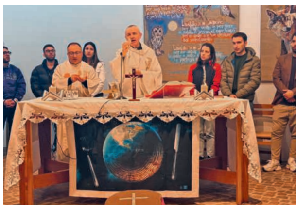
La contemplazione e l'adorazione dell'Eucaristia salvifica: Uniti nel nome del Padre, del Figlio e dello Spirito Santo