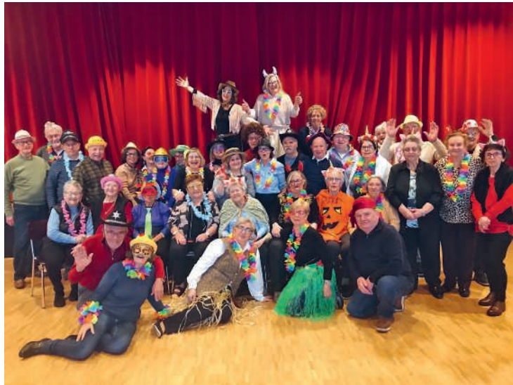
Carnevale della terza età a Rüti-Tann