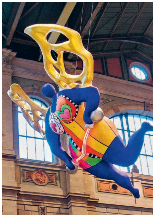
Una scultura nella hall della stazione centrale di Zurigo

Dopo la Messa seguirà un momento conviviale: un pranzo vegetariano offerto a un prezzo simbolico, da condividere insieme attorno ai tavoli. Nel pomeriggio invece, a partire dalle ore 12.30, il palco si animerà con un programma variegato, in cui si alterneranno tavole rotonde, discussioni, musica e danza. E per chi desidera uno scambio più personale, ci sarà anche una «panchina del dialogo», dove sarà possibile incontrare il vescovo ed altri rappresentanti della Chiesa in un clima semplice e informale.