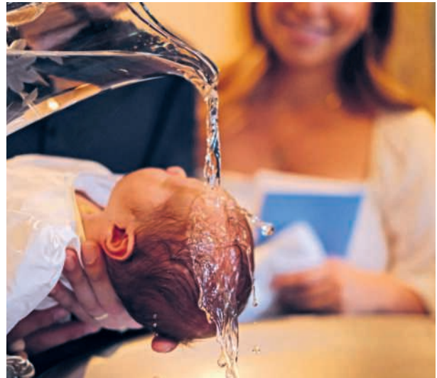
L'acqua che dona vita nuova

Col tempo, i segni di questo inizio riemergono. Accade che, dopo anni, una famiglia si avvicini e dica: «Lei ha battezzato nostro figlio». Quel momento torna vivo, non come un ricordo, ma come una storia che continua. Il bambino è cresciuto, i genitori sono cambiati, e si intuisce che quel gesto ha lasciato un seme. Un seme che, anche in condizioni imperfette, trova il modo di crescere.