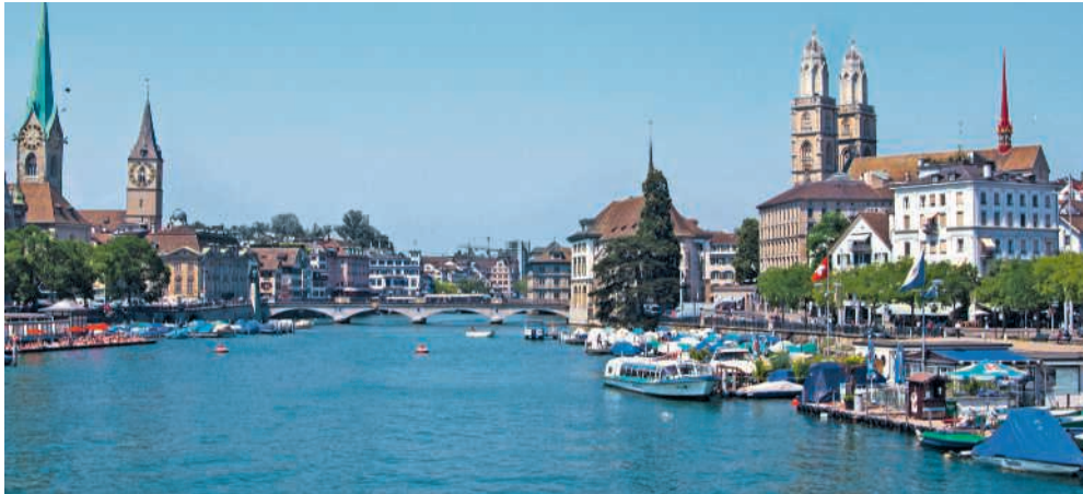
Panorama della città di Zurigo