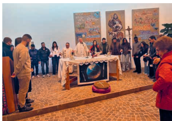
In cerchio intorno all'altare a glorificare e ringraziare Dio, attraverso l'orazione ed il canto