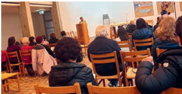
Persone in ascolto della Parola di Dio